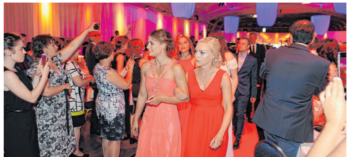
Handys und Kameras wurden gezückt, als die Abiturientinnen und Abiturienten zu Luis Fonsis Sommerhit „Desposito“ in die festlich geschmückte Parkhalle einzogen.