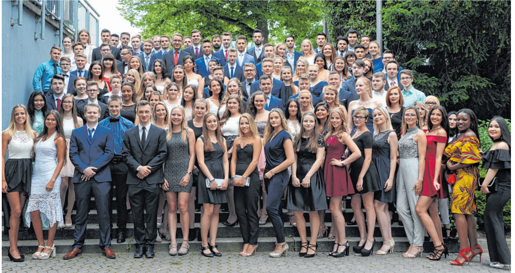
Bestens gelaunt haben sich die Abiturienten der Gesamtschule Iserlohn vor der Zeugnisübergabe im Parktheater präsentiert.